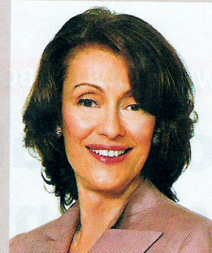
Evelyn Lauder, vice-president van Estée Lauder, is ook voorzitter van de Breast cancer research Foundation en geeft samen met Liz Hurley het startschot voor de borstkankermaand.

(glimlacht) “Ik wilde als kind mensen helpen, zoals mijn papa dokter worden. Eenmaal ik met geneeskunde bezig was, raakte ik gefascineerd door chirurgie. Maar toen bleek al gauw dat ik daardoor veel minder die sociale contacten had met patiënten en dat vond ik nu juist zo interessant. Door me toe te leggen op borstkanker zijn die twee aspecten er weer. En gelukkig komt er bij de collega's met de jaren meer belangstelling voor al wat buiten het strikt chirurgische ligt. Vroeger zou zo'n brede interesse betekenen dat je geen goede chirurg was. Maar dat is veranderd: levenskwaliteit na de behandeling heeft sinds een congres in 1997 meer aandacht gekregen. Meer en meer ge-